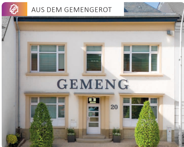
AUS DEM GEMENGEROT